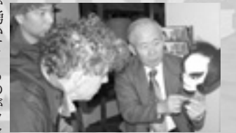
映画シナリオハンティング

ワンカップ大関TVCM よりも淡路島のことを改めて見つめなおし、この島をPRしたいという気持ちで湧いてくるのがフィルムコミッションの魅力です。このように活動そのものが住民にとつての魅力となり、地域の担いになる活動です。当面は我々が小さな依頼をこなしながらフィルムコミッションとしての力を付けていくつもりですが、いずれは地域の自主的な発展のために住民や行政が主体となつて大きな映画を誘致したりできるような組織になっていくよう頑張りたいと考えています。