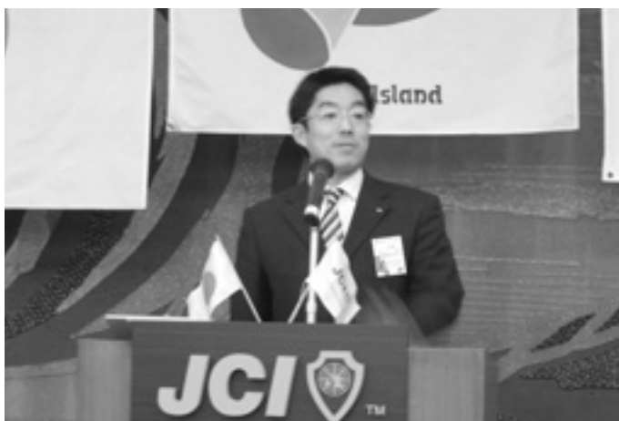
新入会員セミナー

しっかりと確認された理念から信念が生まれます。あとは2007年しっかりと信念を持って時代の先駆けとして45回目の変革、実行に移すのみです。桜の花の寿命は僅か1週間、桜はその時だけのために残りの358日間はしっかりと準備を行い、そして毎年春には日本中の人の心を魅了します。準備は整いました。先輩方が築いていただいた礎を自信とし、淡路島の島民を魅了しましょう。今月もどうぞよろしく願います。