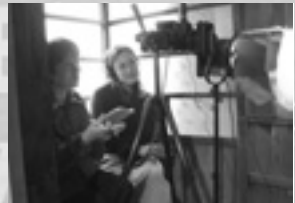
フランス芸術プロジェクト 6billion others

今後強化したい事 ・島民会員の募集 ・事務局スタッフの募集 ・行政・有識者との連携 ・ホームページの充実 ・ロケ候補地の四季の写真集め ・ロケ候補地の撮影条件の整理