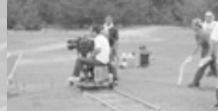
ダイハツ coo TVCM

頼をいただきます。最近では人気漫画の実写版映画やテレビドラマ、商品広告用写真などの依頼で動き回っています。数年前ならフィルムコミッションはありさえすればよかったのが、最近では各地のレベルが上がりつつあるので撮影側の信用と依存が高まったことが全体的な依頼件数増加の原因のようです。