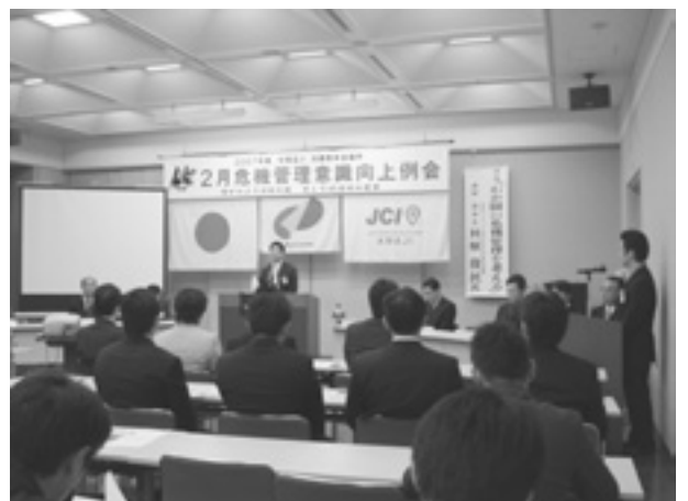
2月危機管理意識向上例会